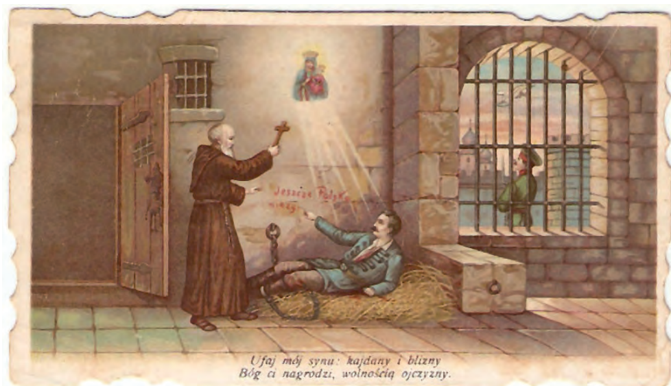
Obrazek o charakterze patriotycznym z XIX w.