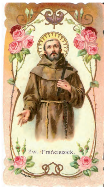
Obrazek ze świętym Franciszkiem z 1891 roku