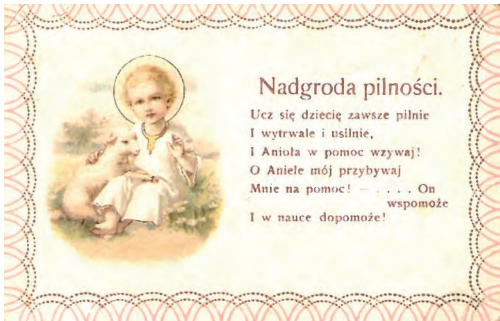
Obrazek o charakterze dydaktycznym sprzed 1920 roku