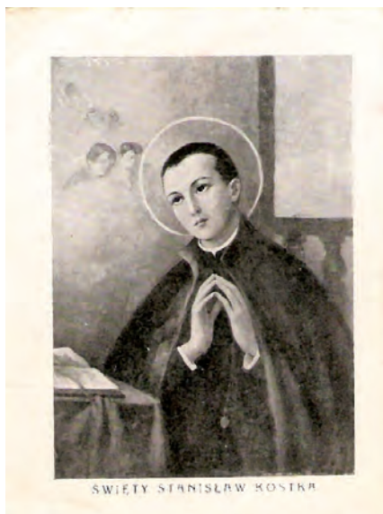
Obrazek ze św. Stanisławem Kostką z 1957 roku, dokument życia społecznego (awers)