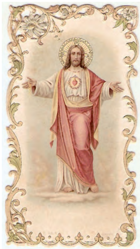
Obrazek o charakterze dedykacyjnym z roku 1907 (awers)