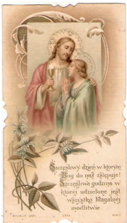
Obrazek prymicyjny z 1907 roku