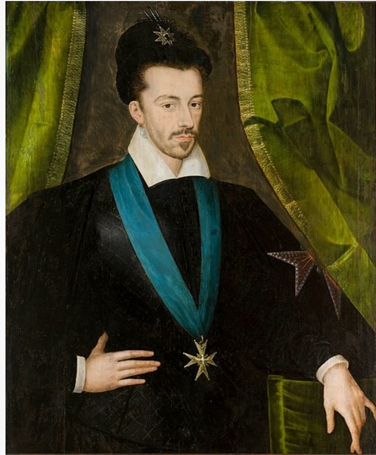
Henryk Walezjusz (1551-1589)