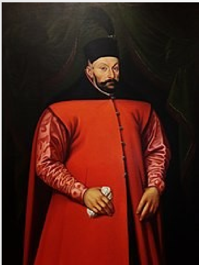
Stefan Batory (1533-1586)