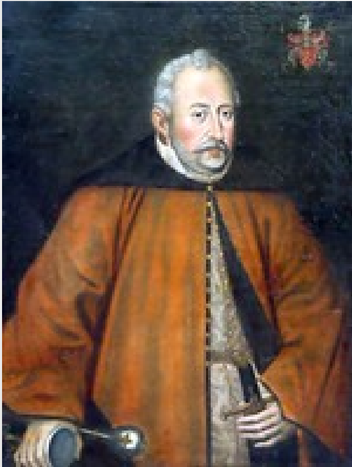
Jan Zamoyski (1542-1605)