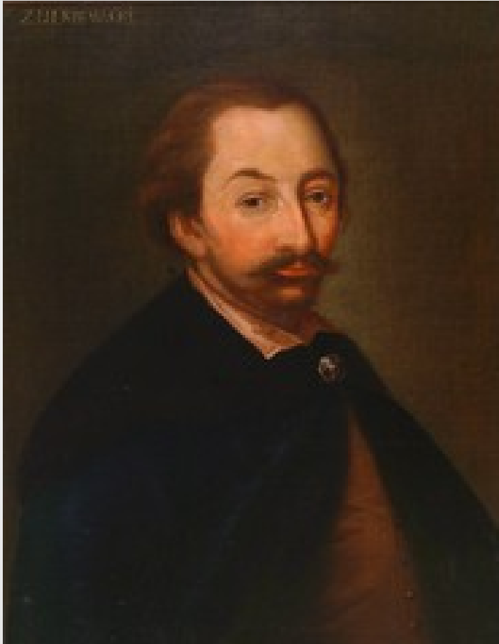
Stanisław Żółkiewski (1547-1620)