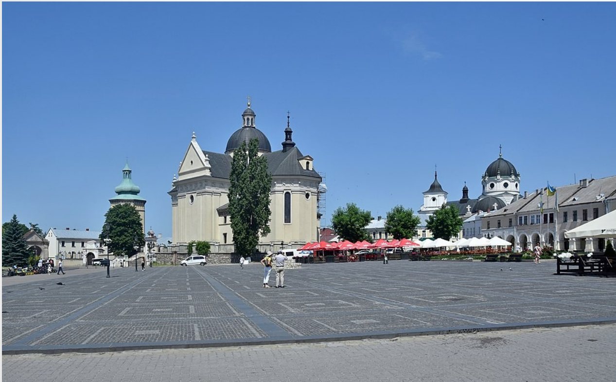
Żółkiew - rynek