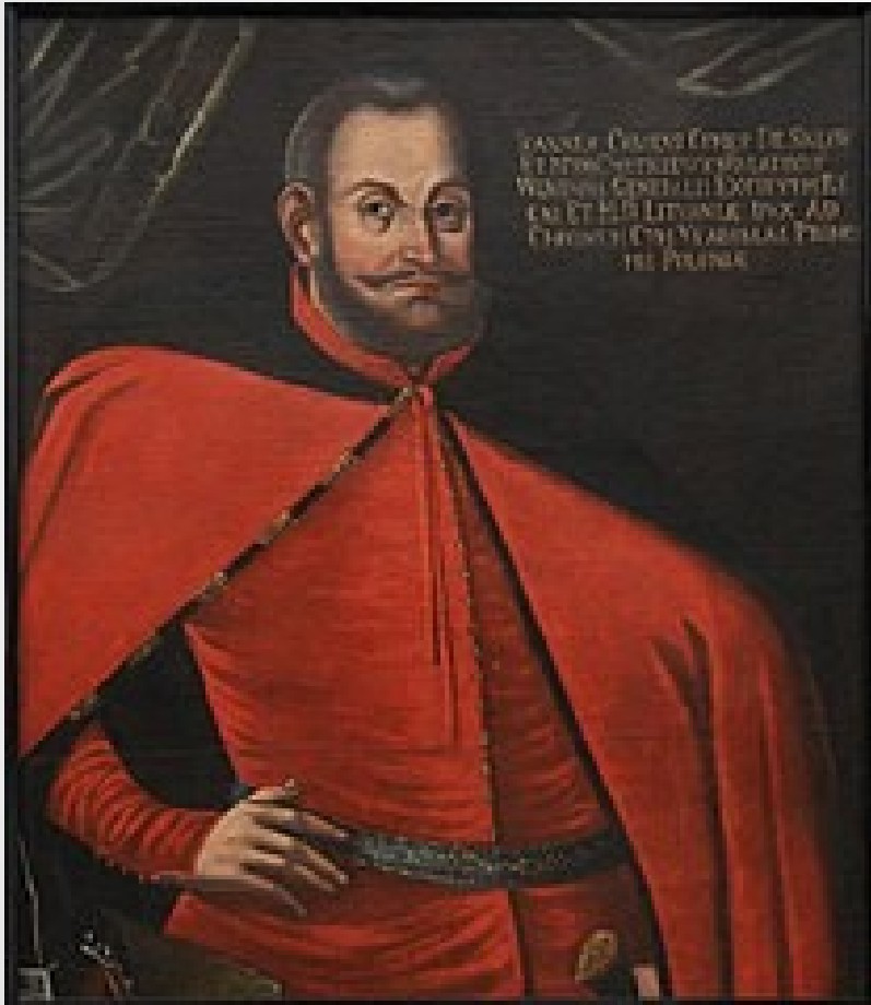
Jan Karol Chodkiewicz (1570/1571-1621)