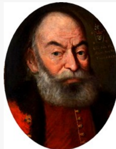
Samuel Zborowski (ok. 1540-1584)