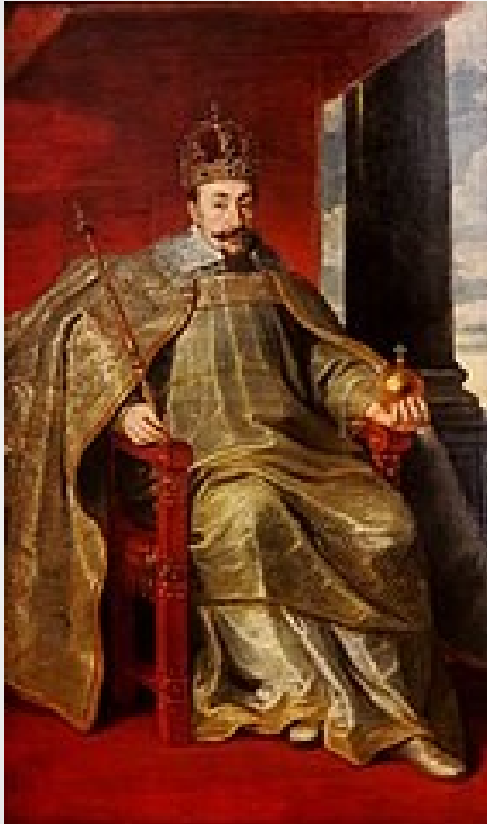
Zygmunt III Waza (1566-1632)